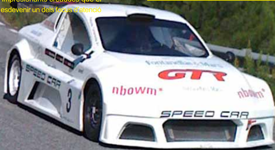
Francesc Fontanellas amb el Speed car GT